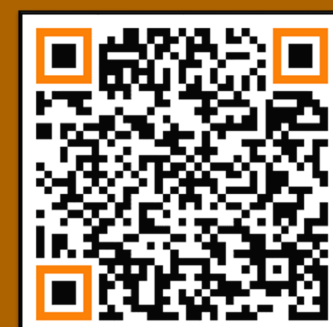
PIDUC. Pla d'Inclusió i Diversitat a les Universitats Catalanes (2024)