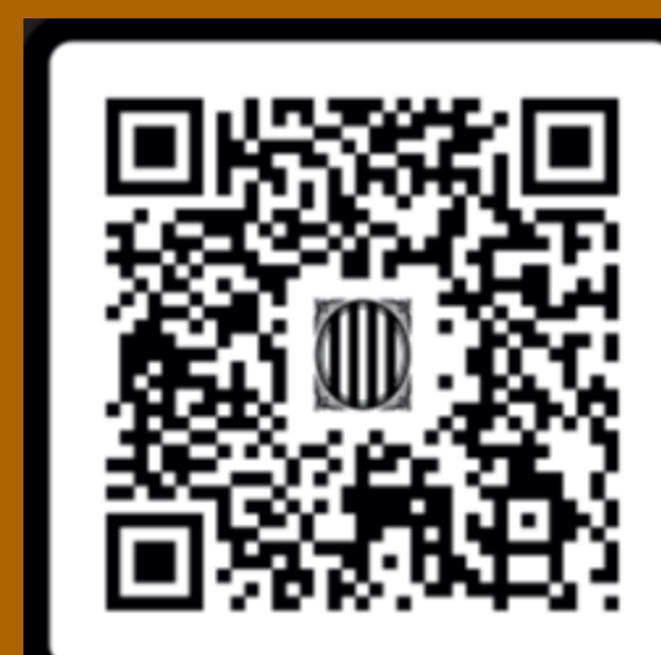
Guia per a l'abordatge de la conducta suïcida en l'àmbit universitari (2024)