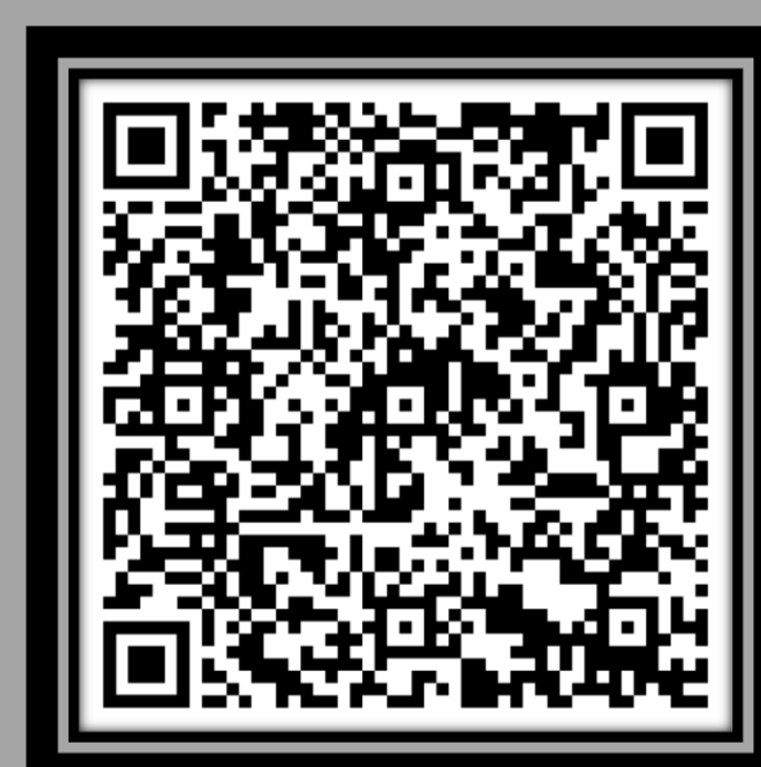
Estudi sobre salut mental en el sistema universitari de Catalunya (2023)