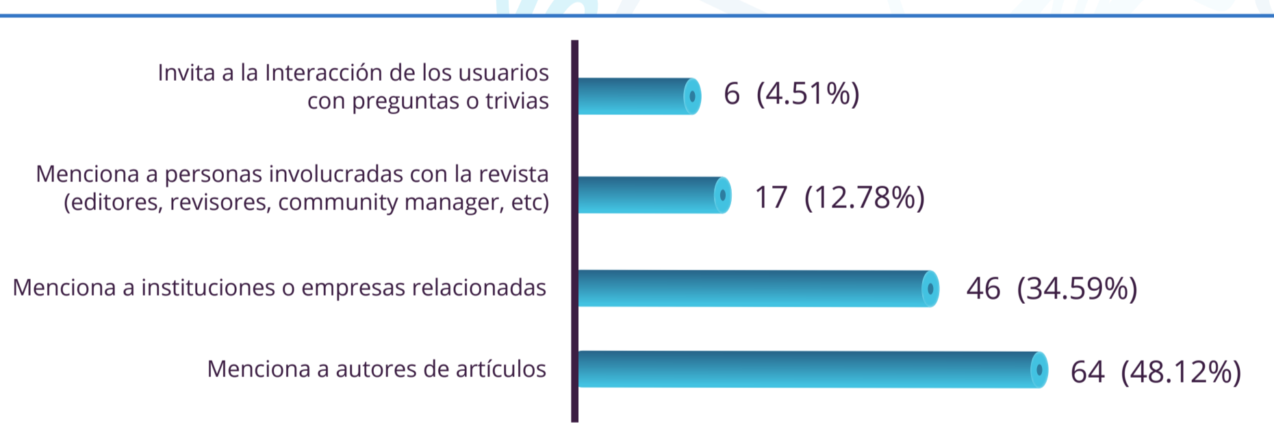
Figura 1. Post con contenido que promueve la interacción.