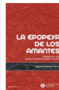
La epopeya de los amantes