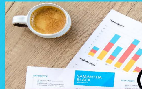
Frecuencias e indicadores