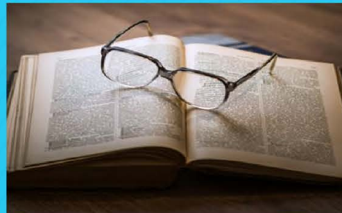
Acceso al texto completo