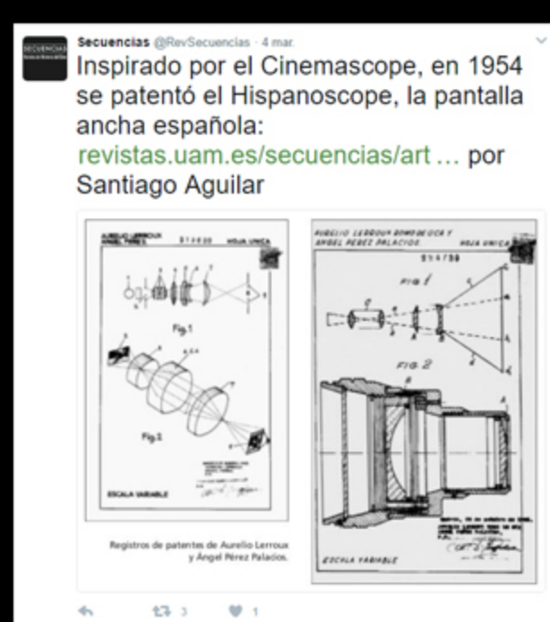
* Collage de imágenes publicadas en el perfil de Facebook de Secuencias

* Tweet @RevSecuencias (4 marzo 2017); referencia al artículo "Hispanoscope: pantalla ancha con patente española" (Santiago Aguilar, 2014, n.º.40)