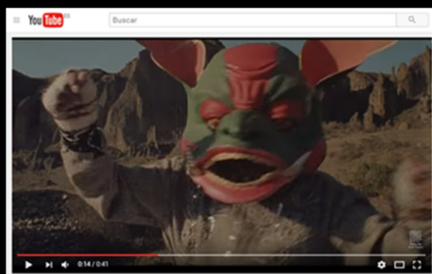
* Trailer de La nación clandestina (Jorge Sanjinés, 1989), facilitado por el Grupo Ukamau (productores) en YouTube * Los materiales (audio)visuales publicitarios suelen estar disponibles de manera gratuita para su uso en Internet

La principal baza que podría jugar esta migración digital es la sustitución de imágenes fijas y fotogramas por videos que ilustraran los estudios sobre cine que son el campo de interés de Secuencias . Revista de Historia del Cine . Son varias las dificultades que impiden y dificultan la integración de videos en nuestra plataforma.